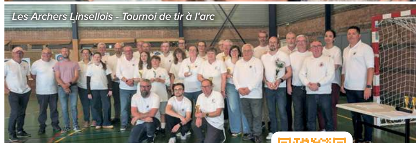
Les Archers Linsellois - Tournoi de tir à l'arc

Retrouvez l'annuaire des associations linselloises en scannant le QR CODE