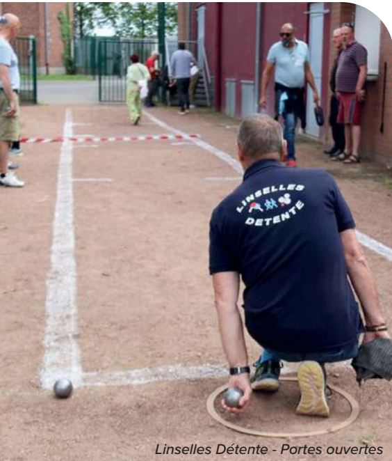
Linselles Détente - Portes ouvertes