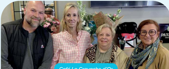
Café La Cravache d'Or