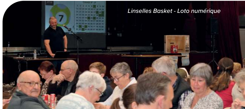
Linselles Basket - Loto numérique