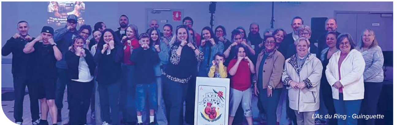
L'As du Ring - Guinguette