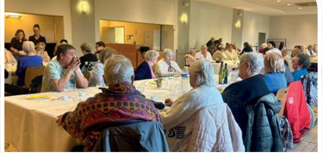
Fraternité linselloise - Repas de printemps

Du sport à la culture en passant par les loisirs, chaque association a contribué à animer notre ville, proposant des rencontres, des compétitions, des ateliers, et bien plus encore !