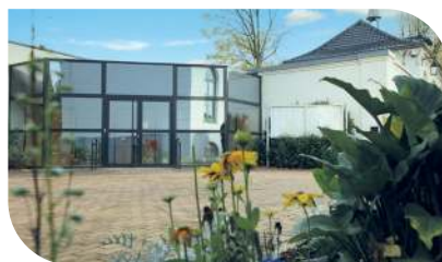
École de Musique