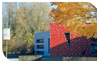
Centre Thérèse Boutry