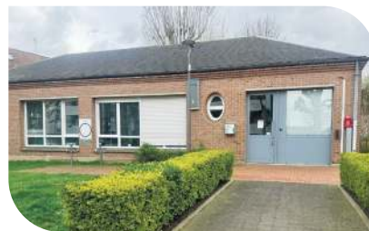
Annexe - Direction des Finances